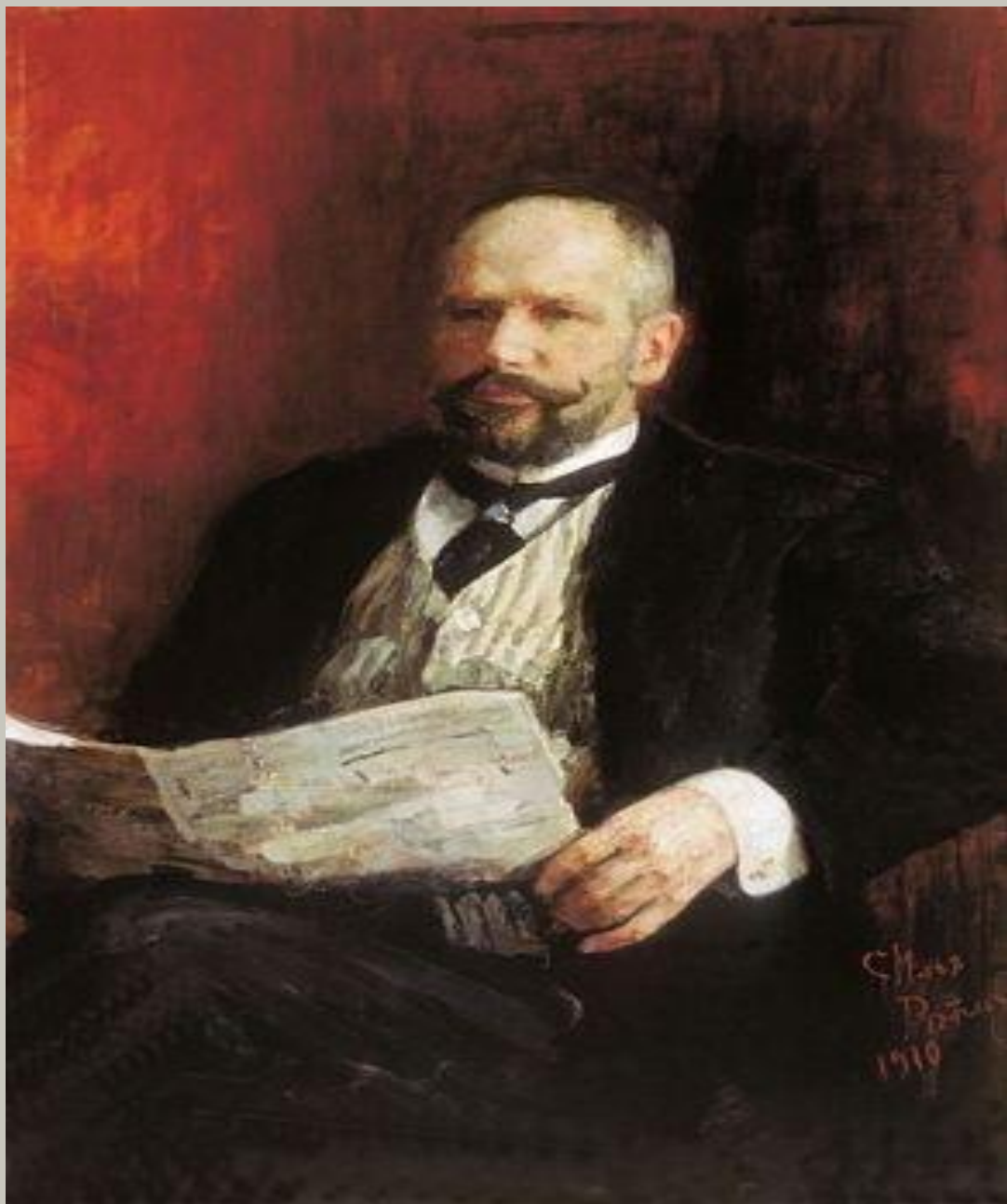
И.Е. Репин. Портрет П. А.Столыпина