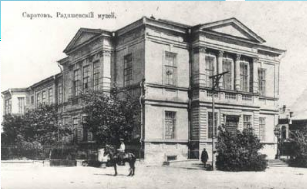
Саратов, Радищевский музей.

Музей был открыт в 1885 году и был первым общедоступным художественным музеем в русской провинции. Основой экспозиции стали дары художника А. П. Боголюбова , внука А. Н. Радищева . Создание музея для Алексея Петровича Боголюбова стало делом всей жизни, потребовавшим немало сил и средств.