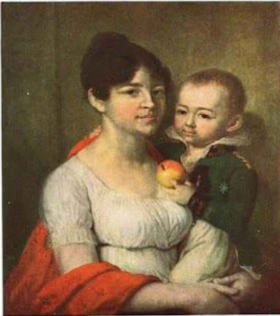
В.Л.Боровиковский. Портрет неизвестной с ребенком.