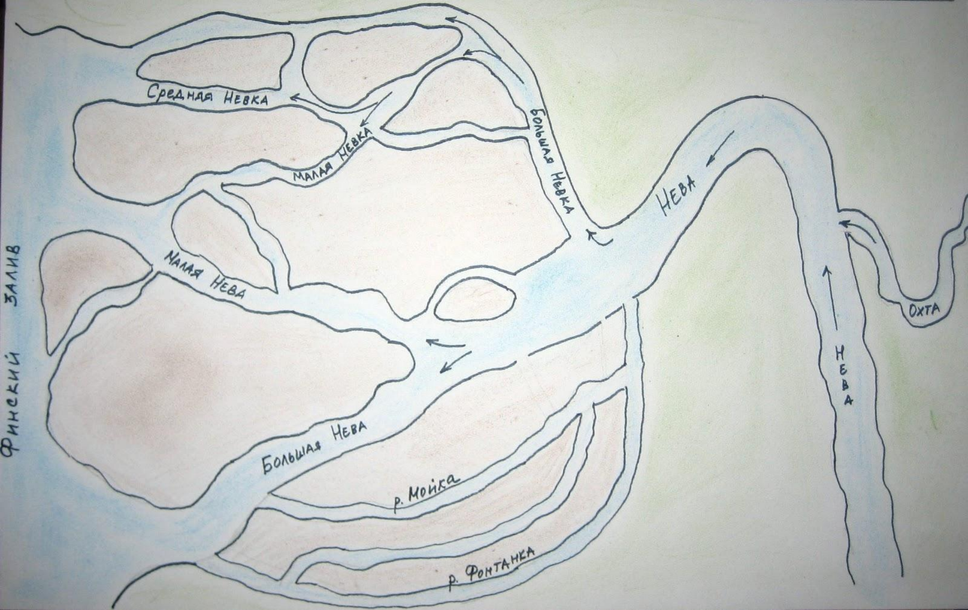
КАРТА - СХЕМА "НЕВА И ОСТРОВА (ДЕЛЬТА НЕВЫ)"