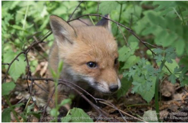
© Анна Сетелиникова Воронежский государственный природный биосферный заповедник им. В.М. Пескова