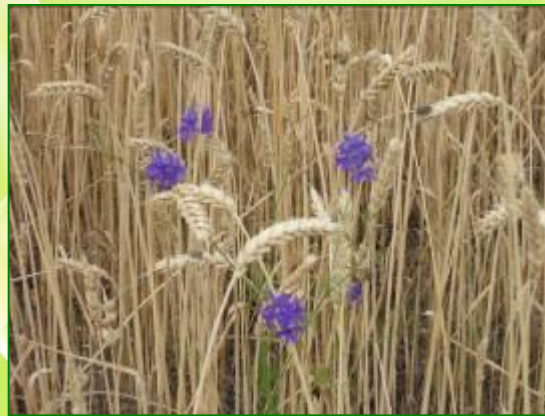
Василёк во ржи