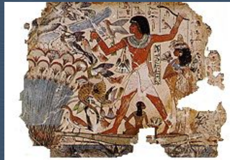
Охотничья сценка с кошкой, найденная в фиванской гробнице. 18-я династия, 1450 до н.э.

По данным археологии, кошки поселились рядом с человеком с тех пор, как он стал вести оседлый образ жизни. Но это были просто дикие кошки, питавшиеся отбросами. Разные исследователи придерживаются диаметрально противоположных взглядов на происхождение домашних кошек. По более старой версии принято считать единым предком домашней кошки североафриканскую переднеазиатскую степную кошку, одомашненную в Нубии около 4 тысяч лет назад. Отсюда, из Нубии, одомашненные кошки попали в Египет, в дальнейшем в Азии скрестившись с лесной бенгальской. В Европе эти кошки скрещивались с местной, дикой лесной европейской кошкой. Итог этих скрещиваний — современное разнообразие пород, линий, расцветок. По другой, более современной версии домашние кошки имеют полифелитическое происхождение, то есть разные породы независимо складывались в нескольких основных центрах.