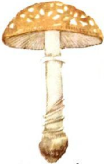
Мухомор пантерный Мухомор пантерный Amanita pantherina