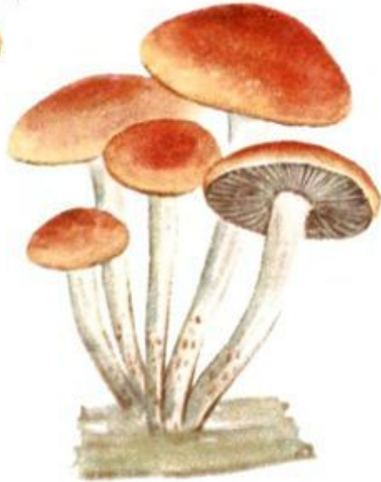
Опеньок цегляно-червоний несправжній Ложноопенок кирпично-красный Hypholoma sublateritium