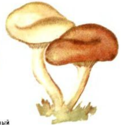
Клітоцибе червонуватий отруйний Клітоцибе ядовитий Clitocybe rivulosa