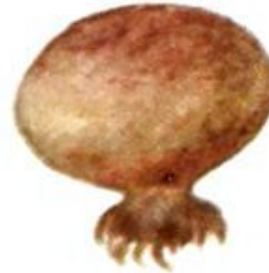
Дошовик несправжній Ложнодождевик обыкновенный Scleroderma aurantium