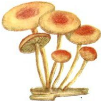
Опеньок сірчано-жовтий несправжній Ложноопенок серно-желтый Hypholoma fasciculare