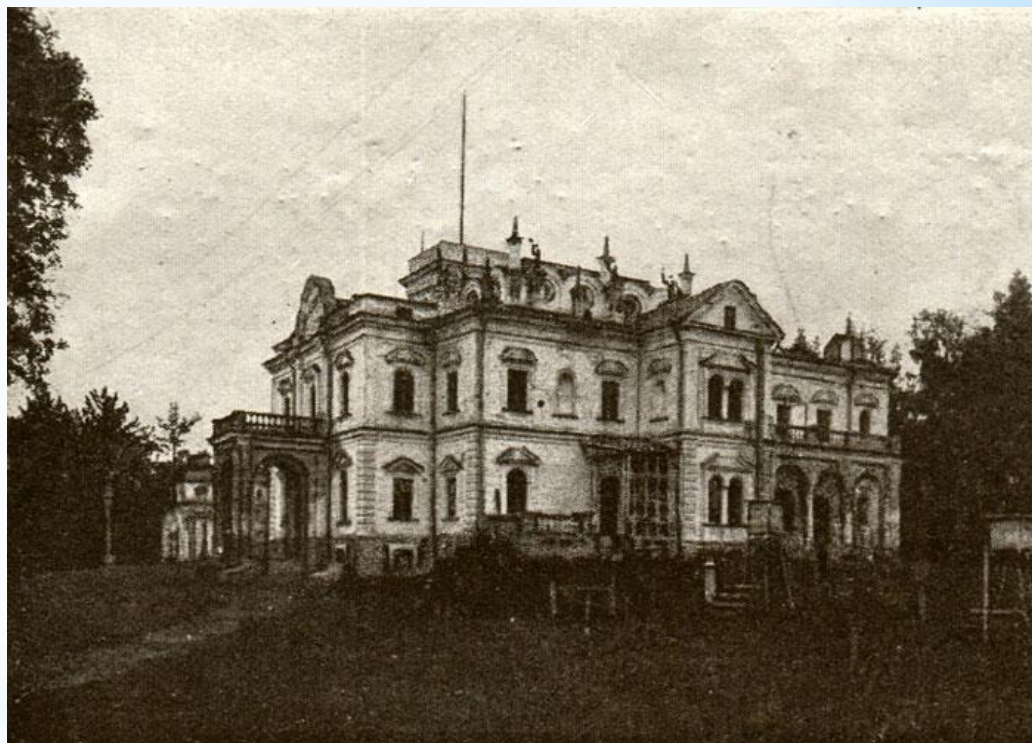
Здание Лахтинской экскурсионной станции

* В том же 1919 году на берегу Невской губы в особняке графов Стенбок-Ферморов, владевших окрестными землями до революции, начала работать Лахтинская экскурсионная станция.