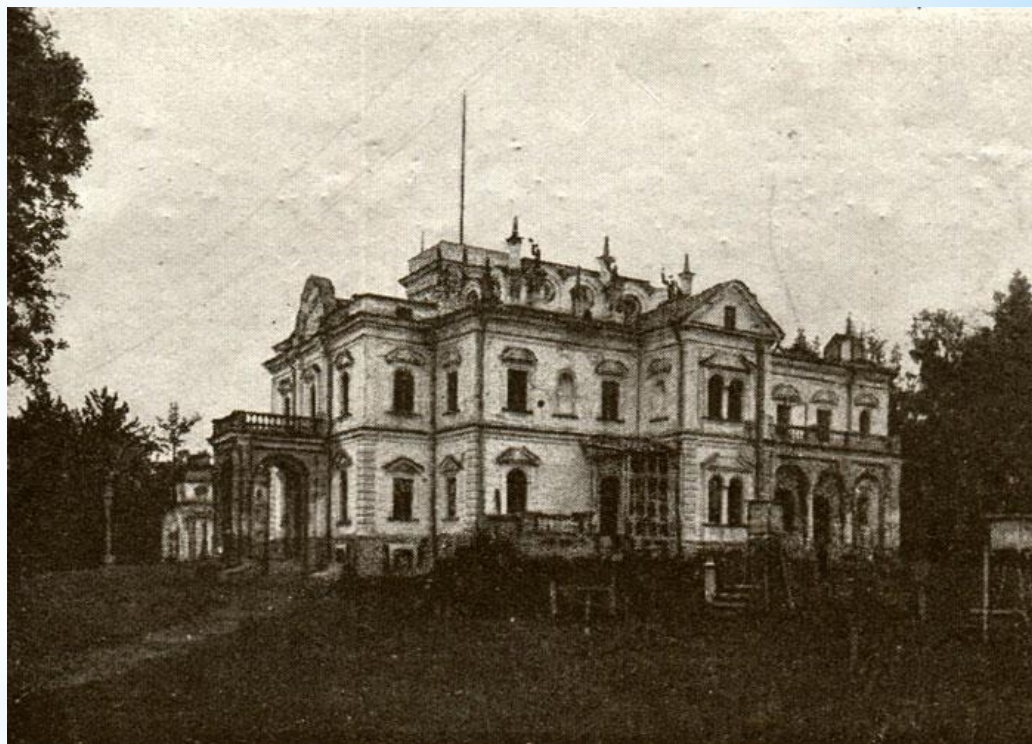
Здание Лахтинской экскурсионной станции

* В том же 1919 году на берегу Невской губы в особняке графов Стенбок-Ферморы, владевших окрестными землями до революции, начала работать Лахтинская экскурсионная станция.