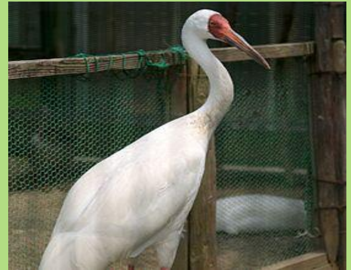
стерх или белый журавль

Все эти виды внесены в Международную Красную книгу