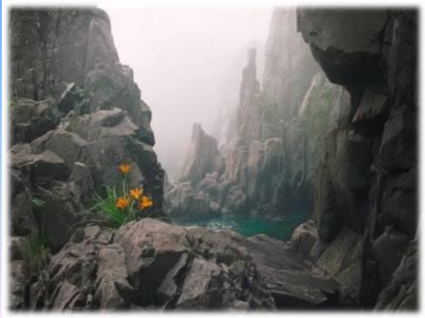
Скалы в Большом Арктическом заповеднике

Большой Арктический крупнейший заповедник России и третий по площади в мире. Он расположен на полуострове Таймыр и островах Северного Ледовитого океана.