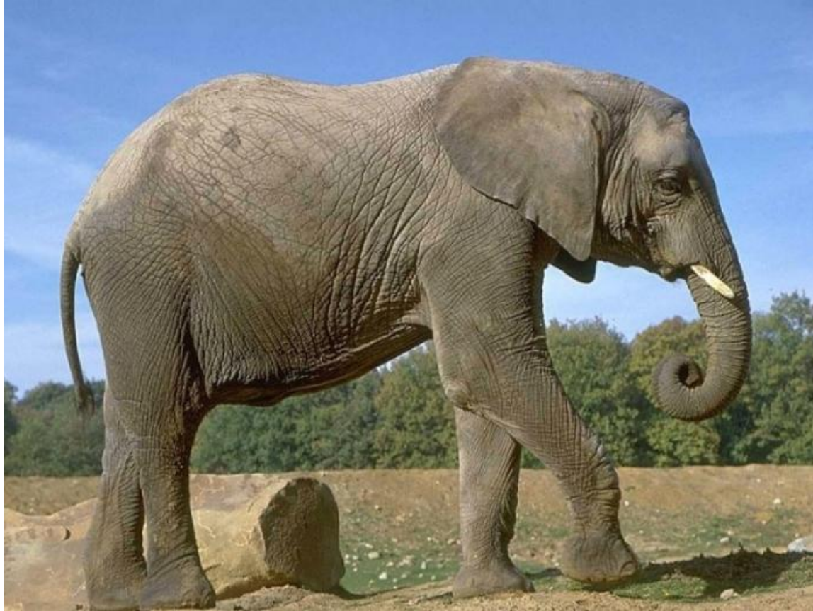
Самый крупный африканский слон