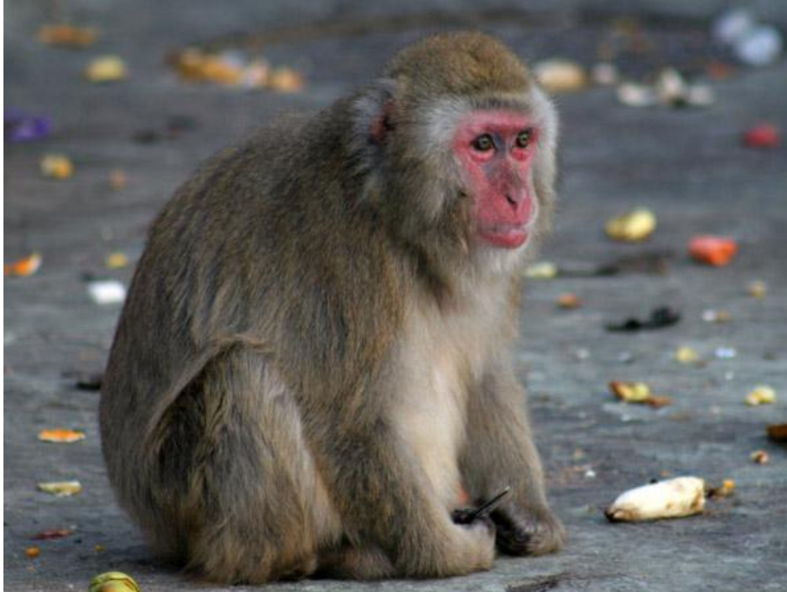
Смешная обезьяна- мартышка