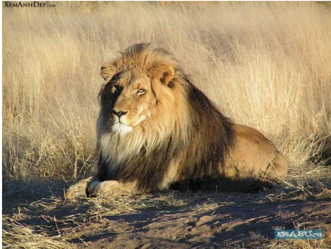
Лев царь зверей