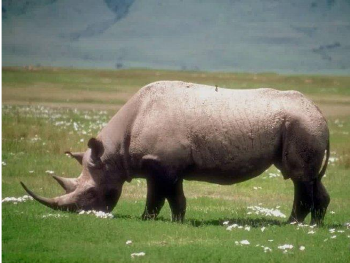
Носорог – травоядное животное