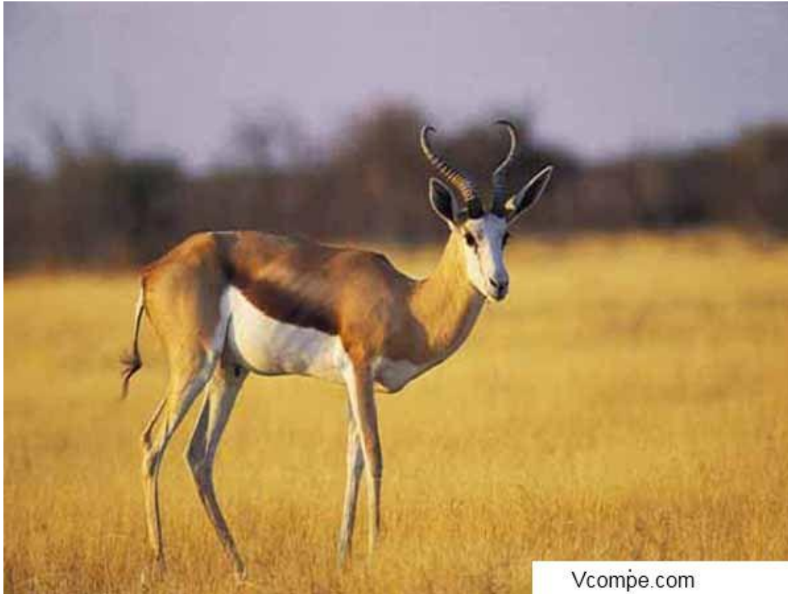
Антилопа житель саванн