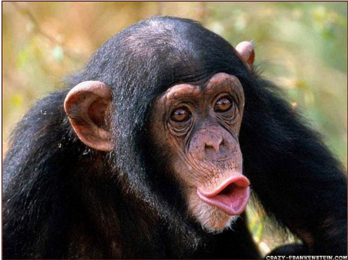
Еще одна обезьяна