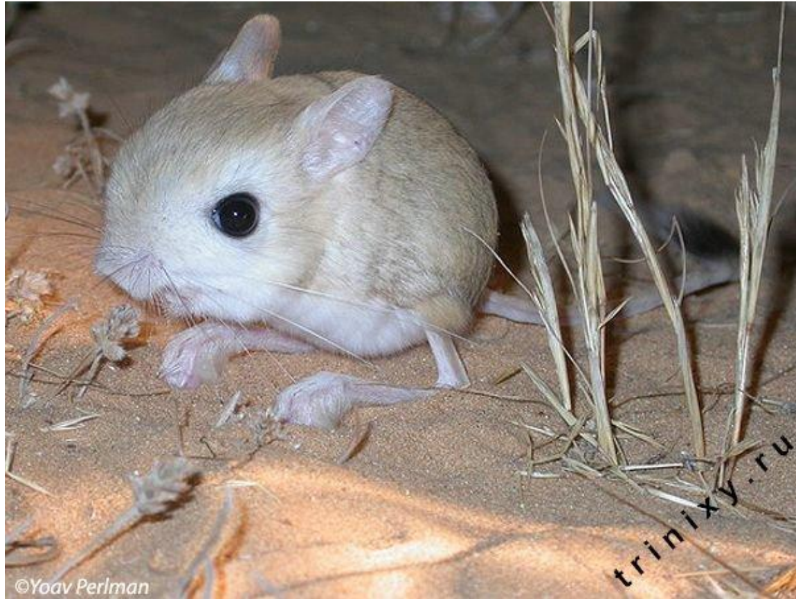
Тушканчик житель пустыни