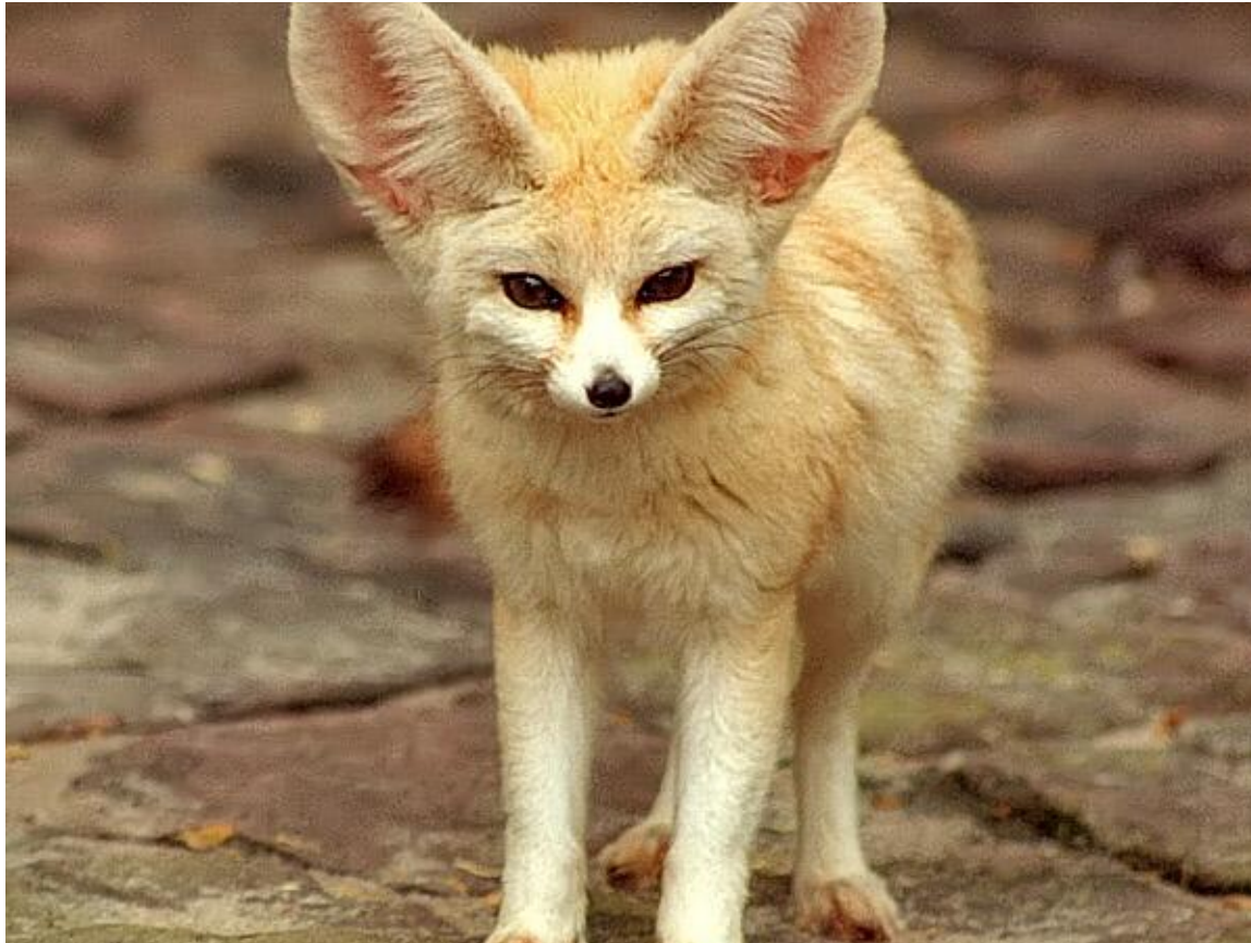
Маленькая лисичка фенек