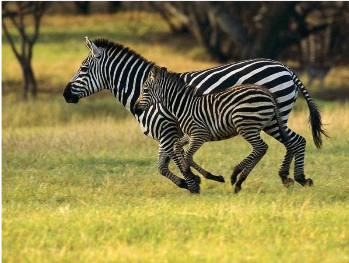
Зебра в черно-белую полоску