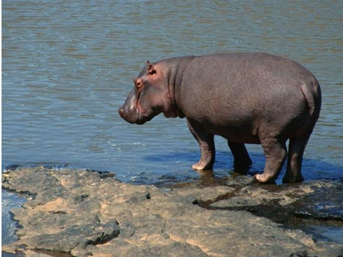
Бегемот или гиппопотам