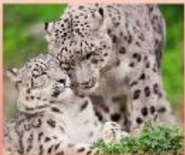
Снежный барс (ирбис)