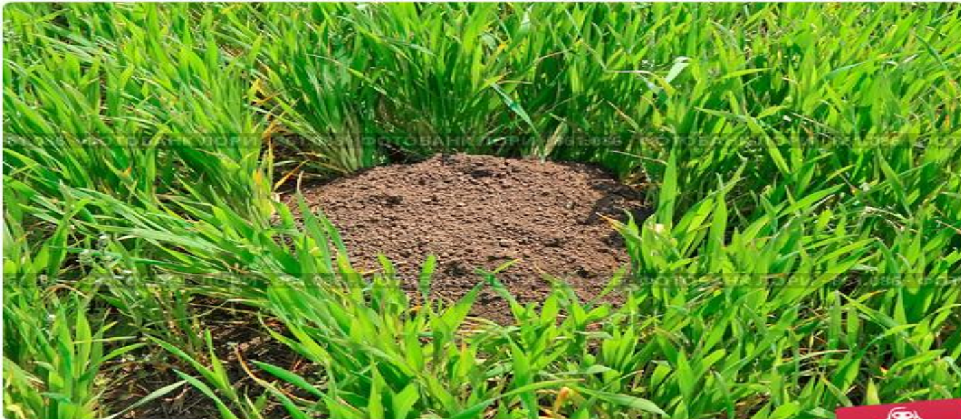
Кротовая нора