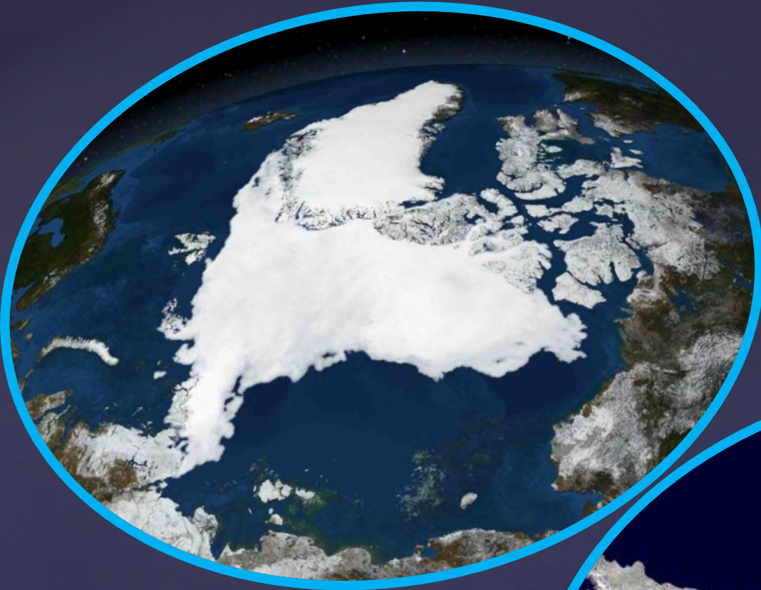
Арктика. Северный полюс