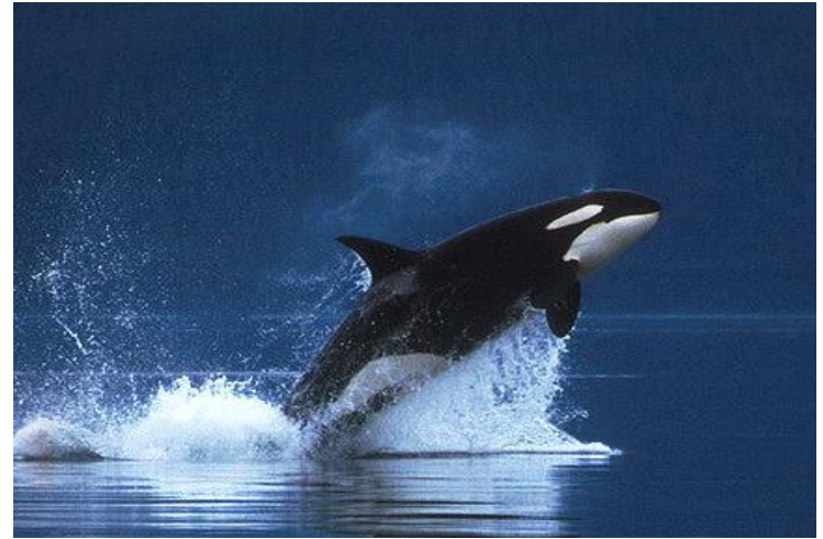
КИТ ( касатка)