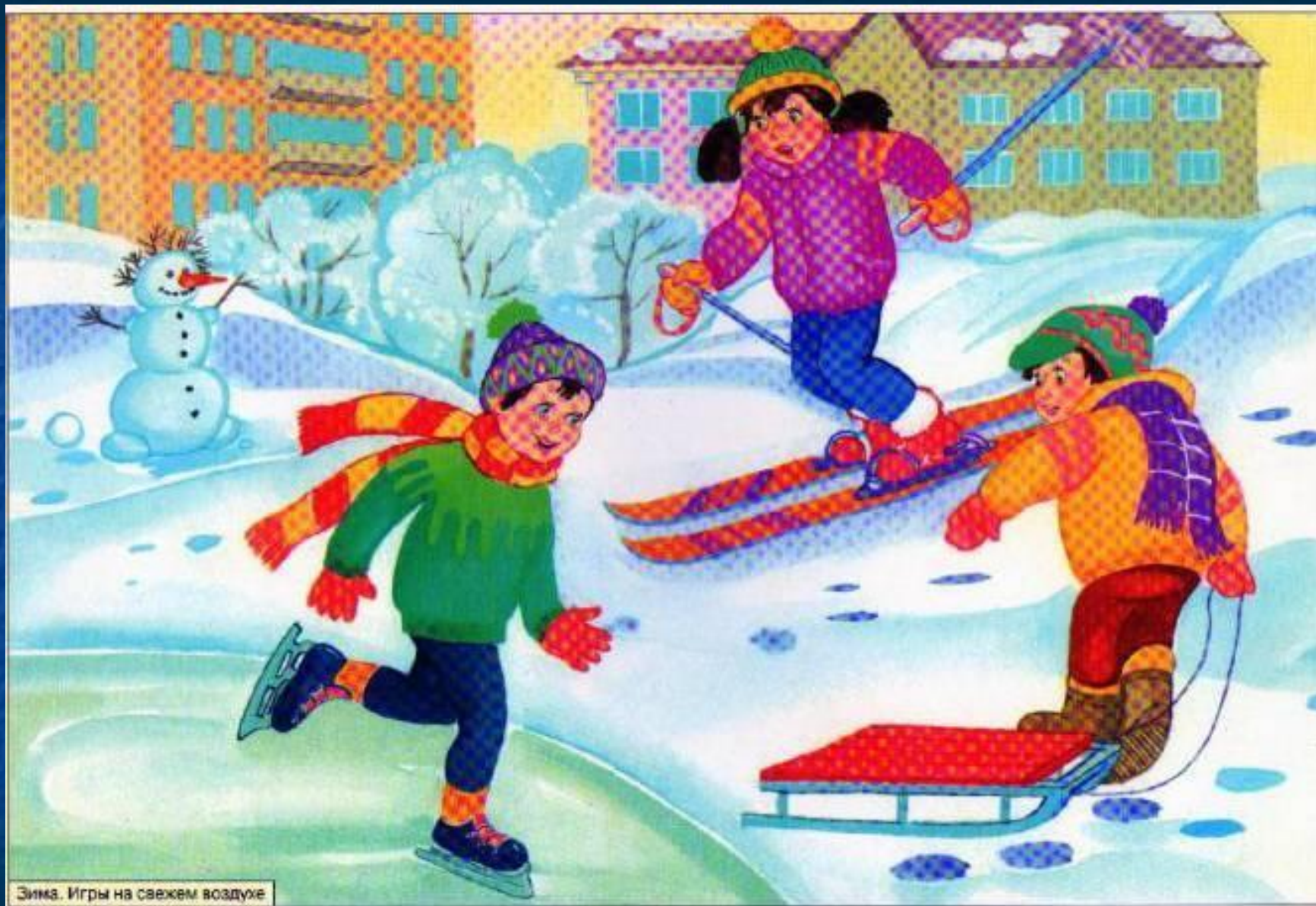
Зима. Игры на свежем воздухе