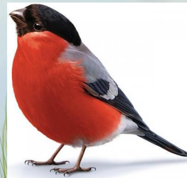
Снегирь любит есть