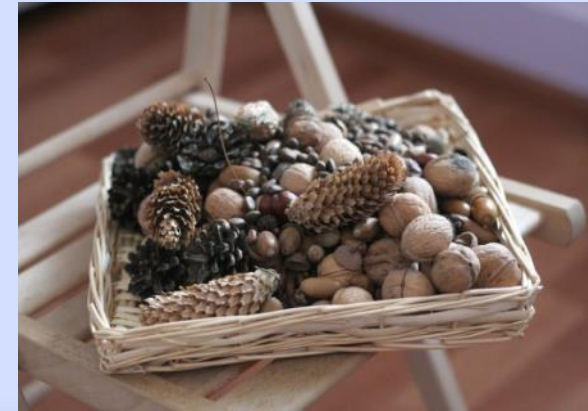
Шишки, желуди, орехи