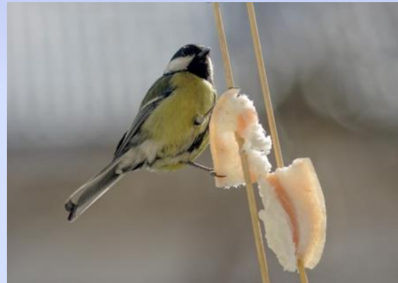
Не соленое сало