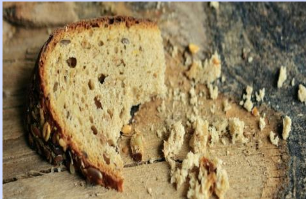
Крошки пшеничного хлеба