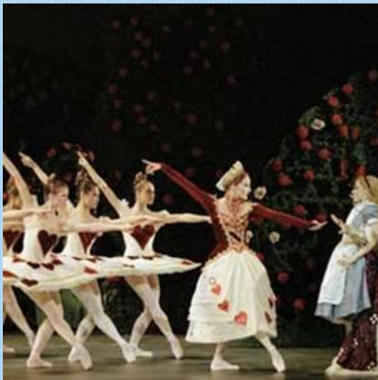
Алиса в Стране Чудес