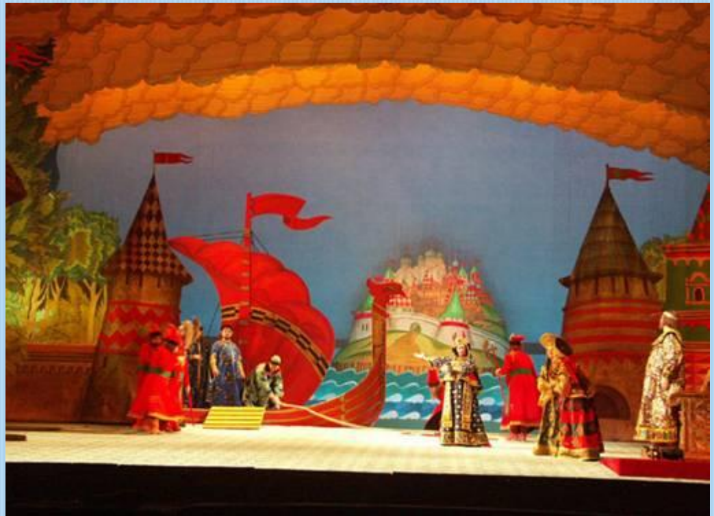
Сказка о царе Салтане