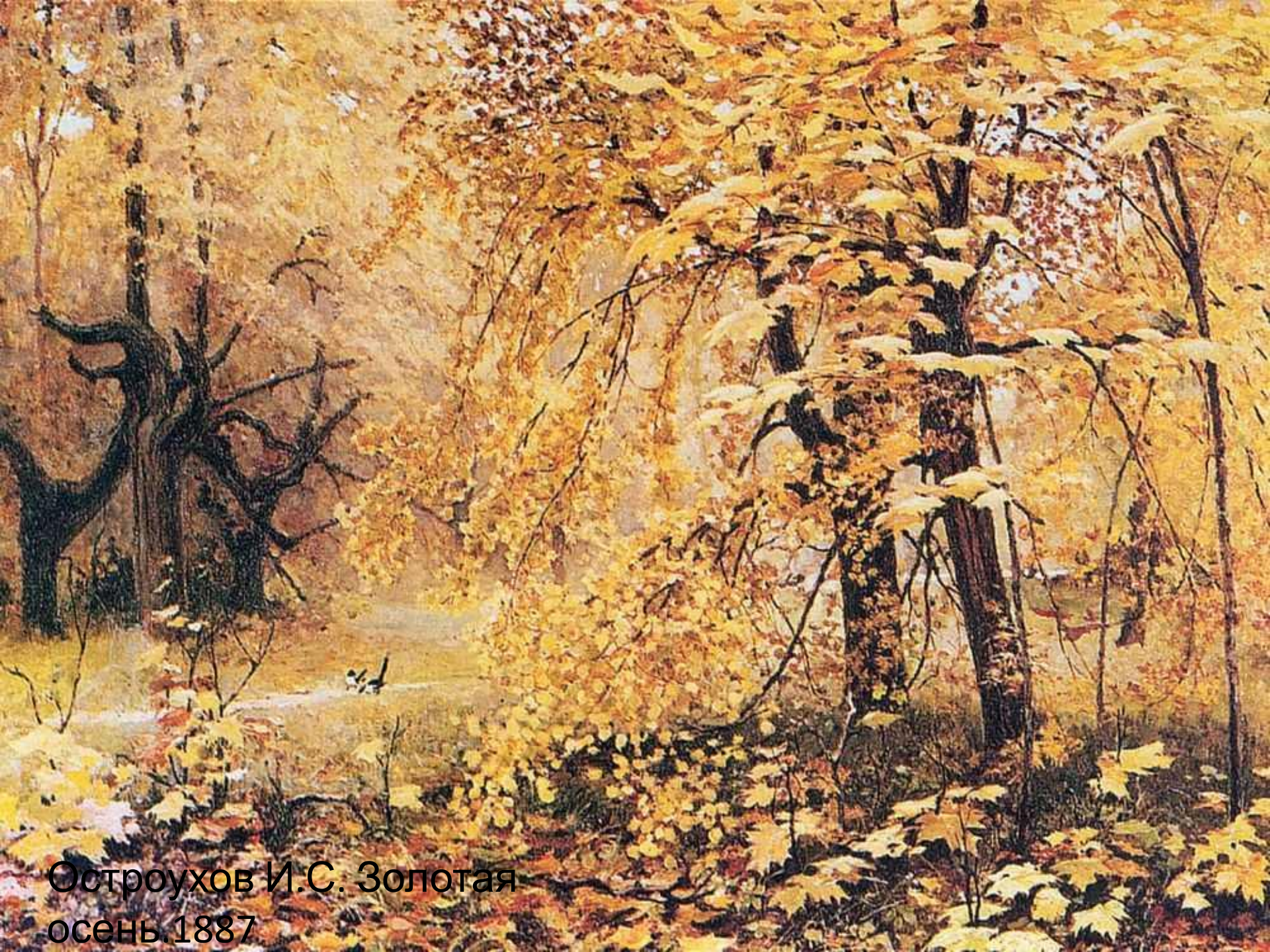
Остроухов И.С. Золотая осень 1887