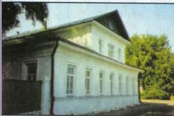
Дом-музей И.И. Левитана