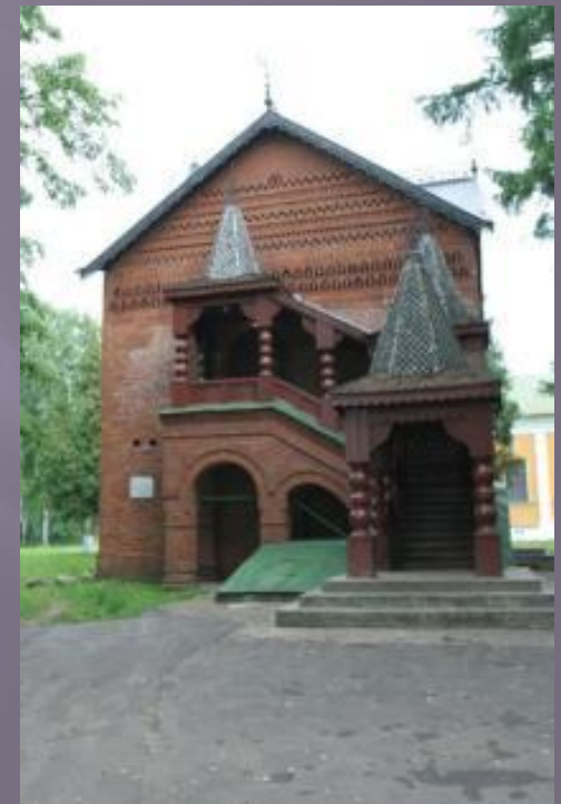
Палаты царевича Димитрия