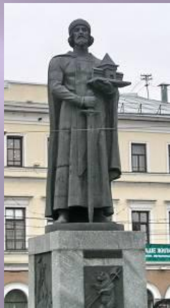
Памятник Ярославу Мудрому

Ярославль — самый крупный город Золотого кольца. Он был основан князем Ярославом Мудрым, имя которого и носит. Город тоже стоит на Волге. Вдоль реки можно прогуляться по очень красивой набережной. В центре города мы увидим памятник Фёдору Григорьевичу Волкову. Этот замечательный человек создал в Ярославле первый в России общедоступный театр. Вот почему Ярославль называют родиной русского