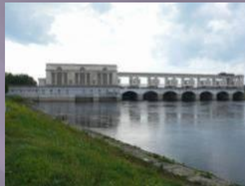
Вид Угличской ГЭС с ул. Спасской