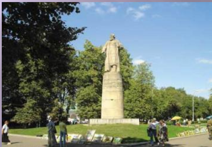
Памятник Ивану Сусанину