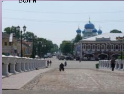
Вид на Успенскую площадь в Угличе