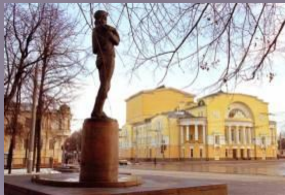
Театр имени Ф. Волкова и памятник Ф. Волкову