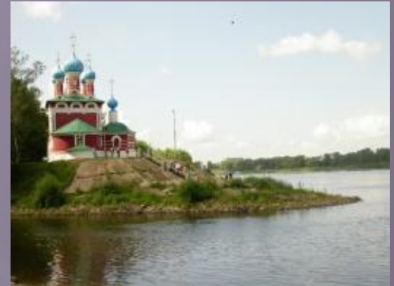
Угличский кремль, церковь царевича Димитрия на Крови (1692)