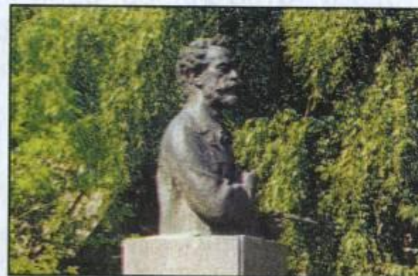
Памятник И.И. Левитану