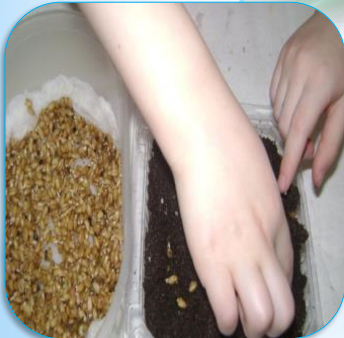
Посев в землю