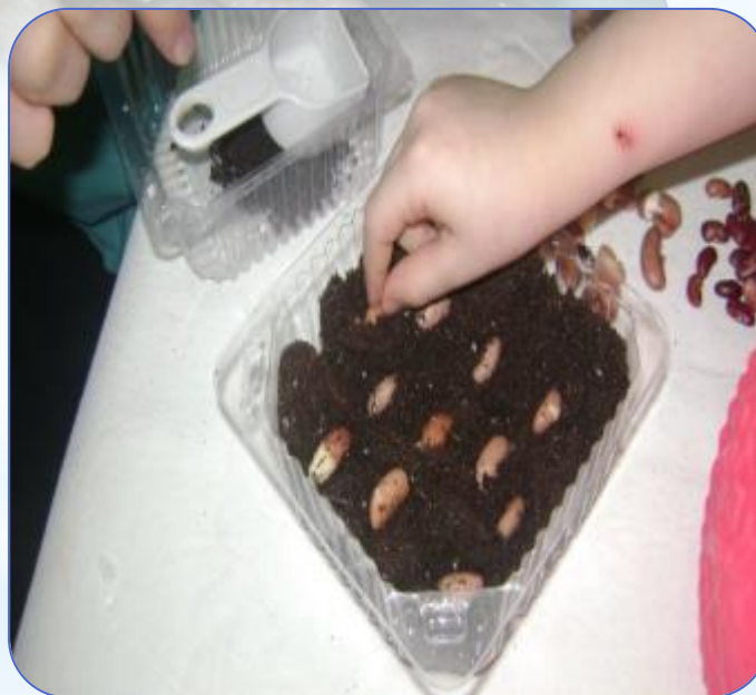
Посев в землю