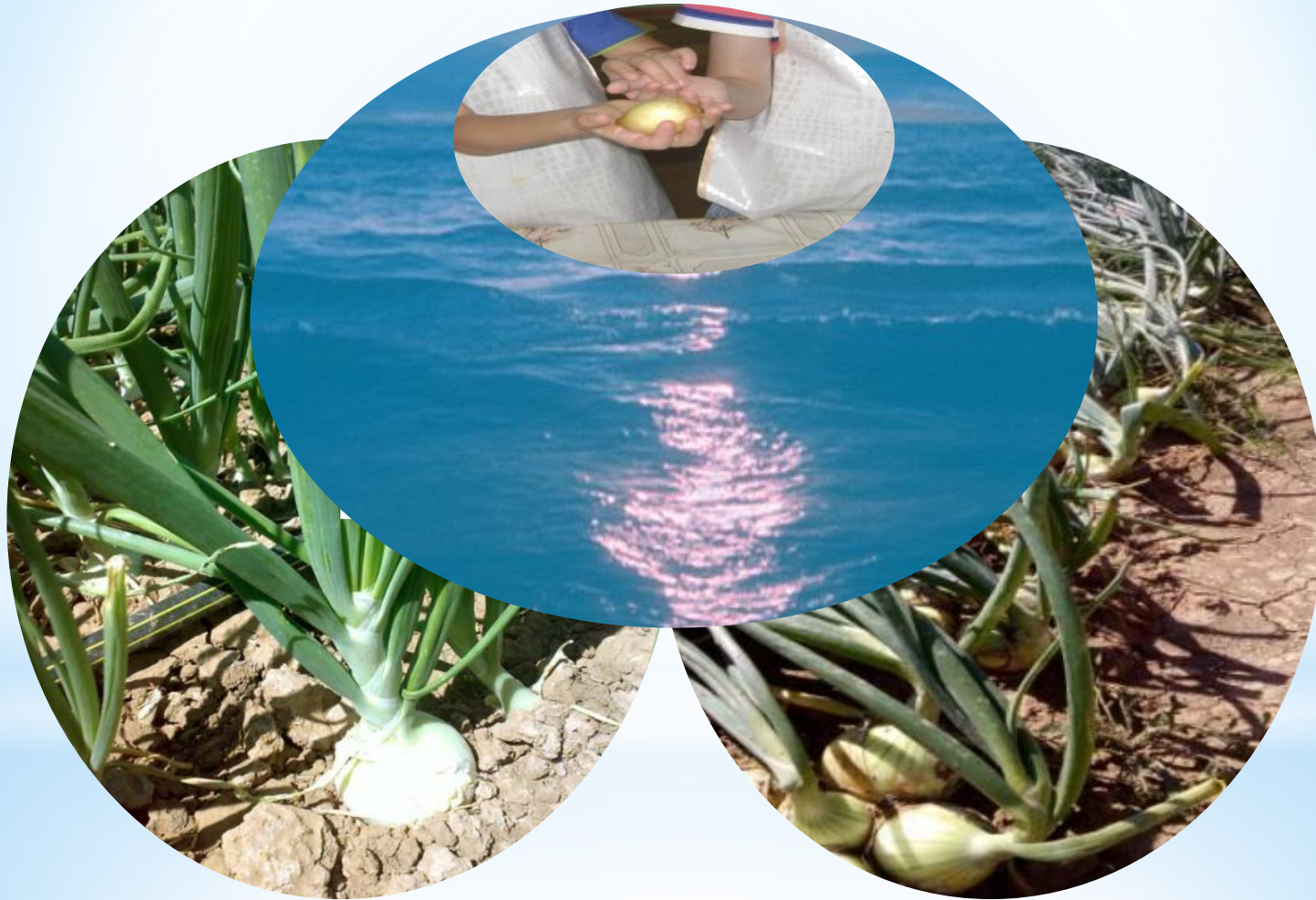
Луковица репчатого лука

Цель : Довести до детей важность воды для жизни растений ,влияние воды на рост и развитие растений