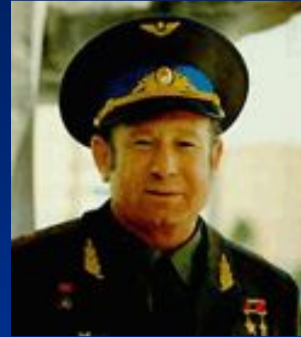
Алексей Леонов, дважды Герой Советского Союза, летчик-космонавт СССР