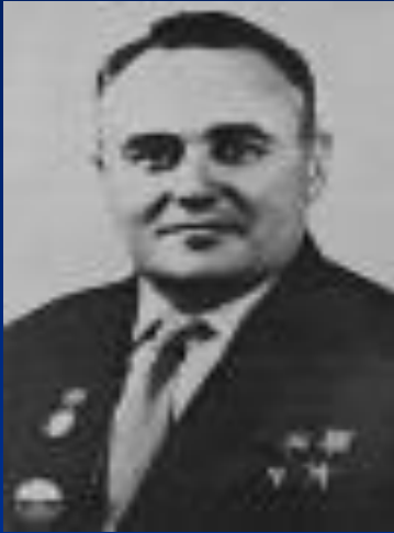
Сергей Королев, генеральный конструктор космического корабля «Восток»

Он открыл людям Земли дорогу в неизведанный мир.