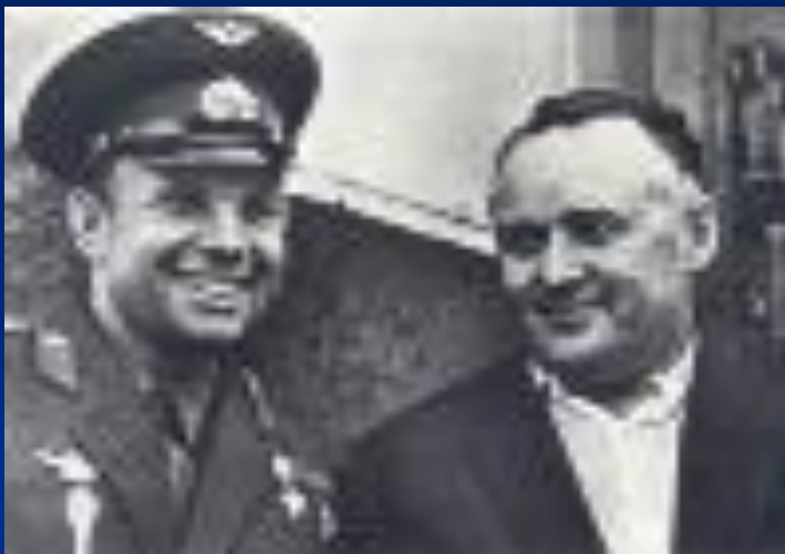
Ю.А.Гагарин и С.П.Королёв

«Он сказал: «Поехали!» И взмахнул рукой»