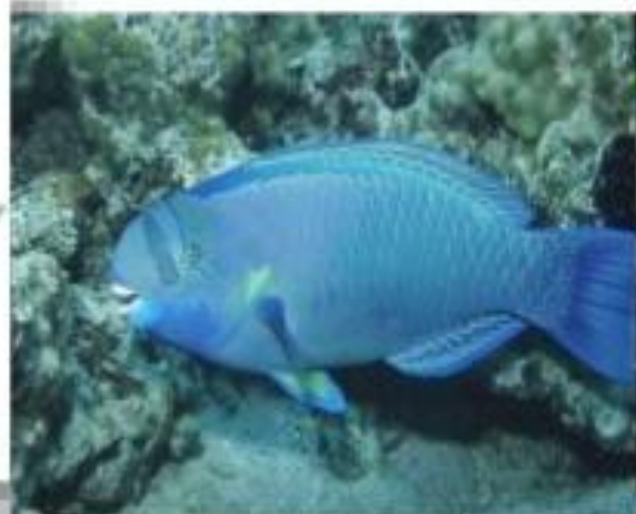
Рыба - попугай