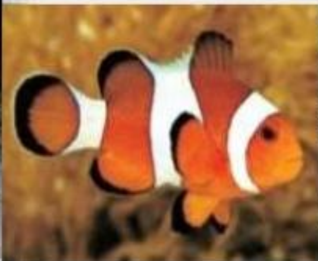
Рыба - клоун