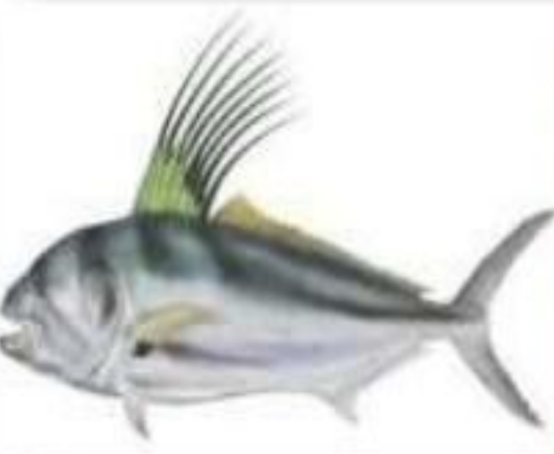
Рыба - павлин