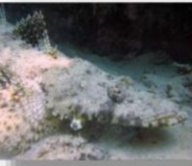
Рыба - крокодил