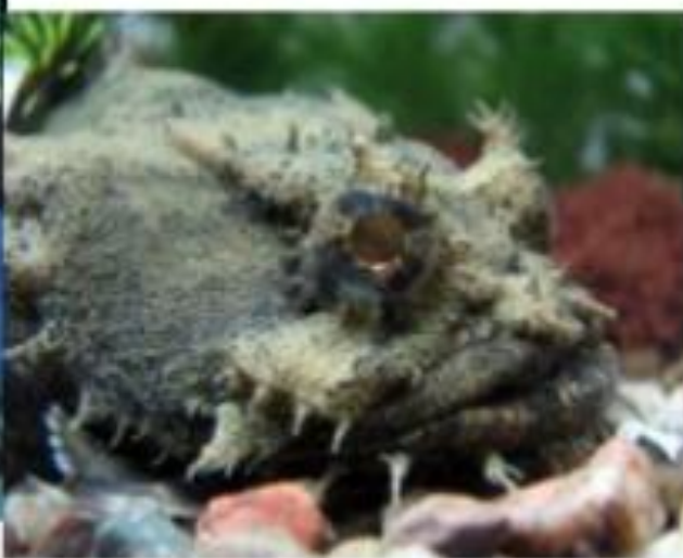
Рыба - жаба