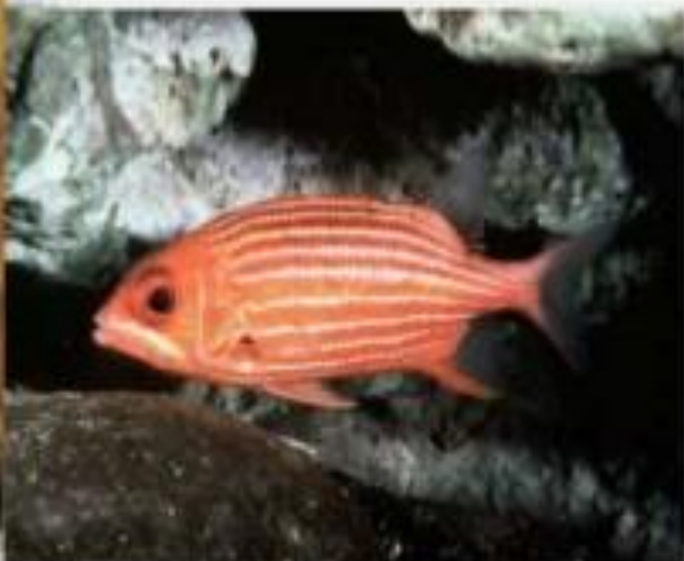
Рыба - белка