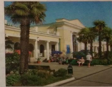
Город Сочи — город-курорт. Это место проведения зимних Олимпийских игр 2014 года.