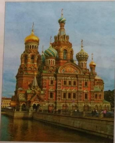
Город Санкт-Петербург — один из красивейших городов мира. Его часто называют второй столицей России.

Подготовьте фоторассказ о своей малой родине.