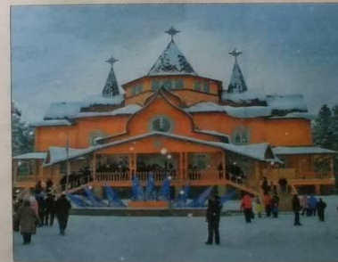
Город Великий Устюг — родина любимца детей и взрослых Деда Мороза. Здесь расположена его резиденция.