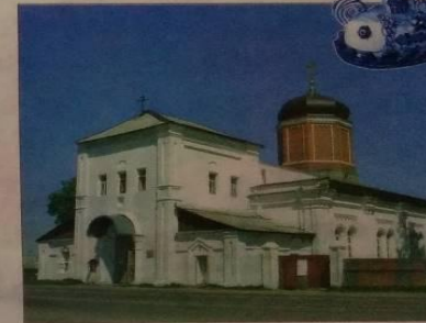
Село Гжель в Московской области славится знаменитыми изделиями из глины — гжельской керамикой.