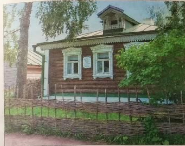
Село Константиново в Рязанской области — родина поэта Сергея Есенина.