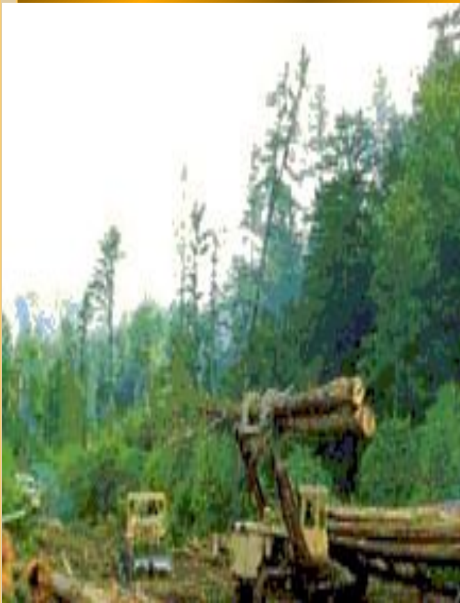
Лесозаготовка близ Лесозаводска