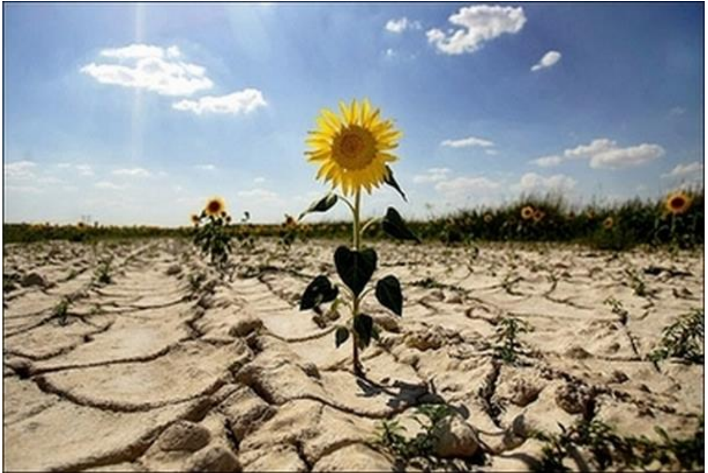
Извержение вулкана засуха

Часто причиной гибели диких животных являются природные явления.