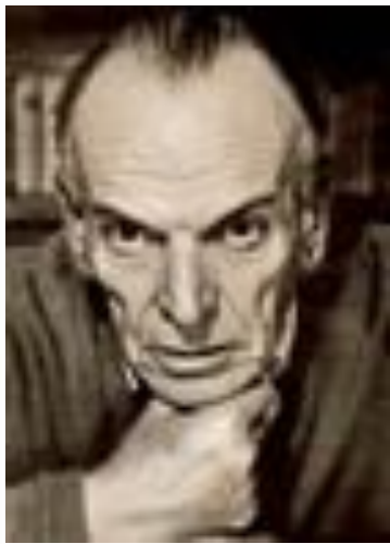
Константи н Паустовски