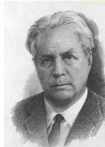
Георгий Скребицки й