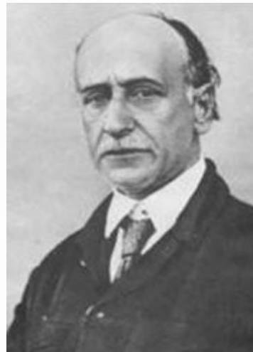
Борис Житко в