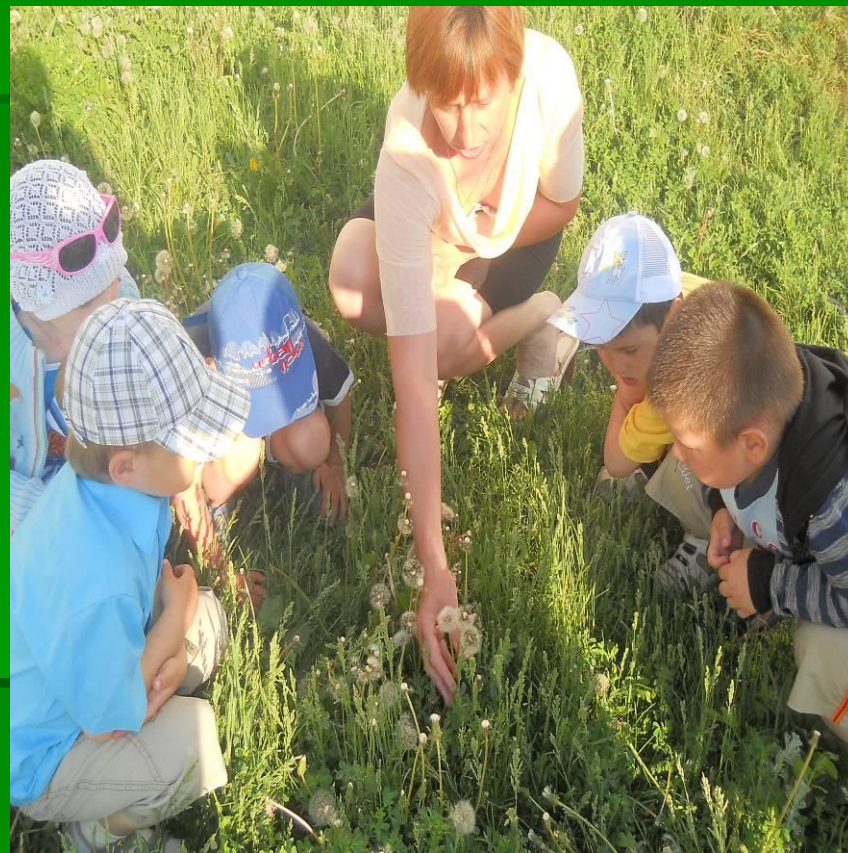
А теперь он стал седой