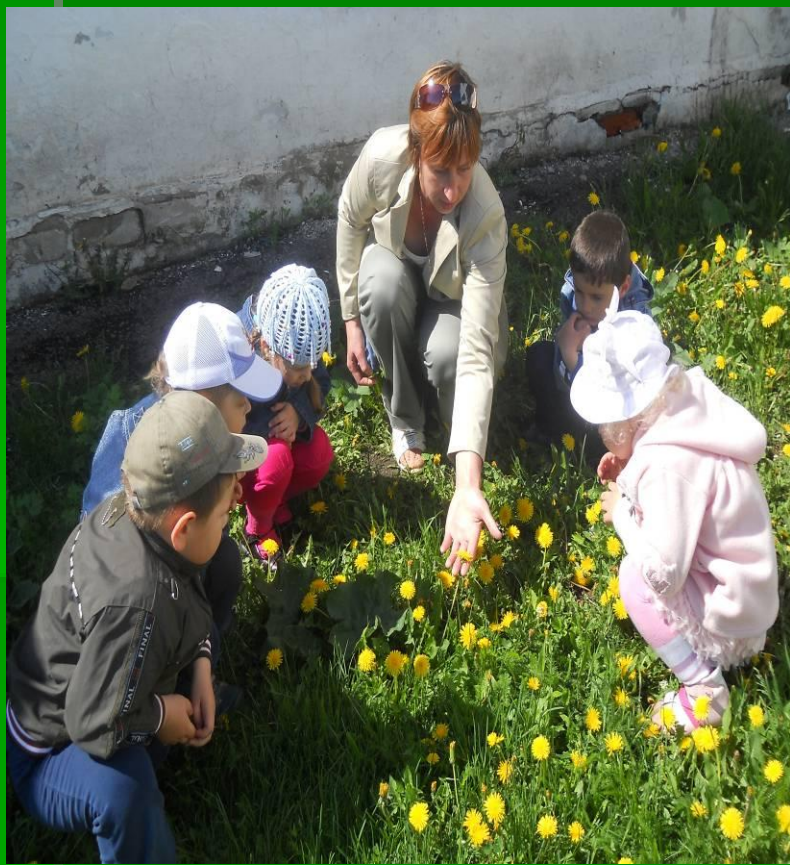
Был одуванчик золотой