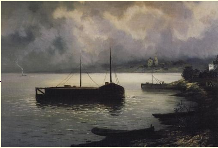
И.Левитан «На Волге»

Щедрая, широкая, раздольная Волга величавая течет. Своенравная, как птица – вольная, Все «ключи» собрав наперечет. Шумная, бурливая, привольная... Теплоходы катит по волнам. По ночам – степенная, спокойная – Ластится к пологим берегам.