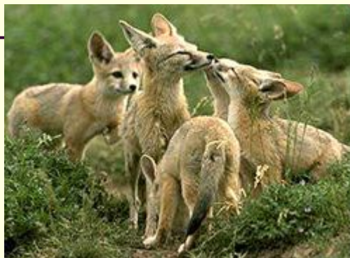
Корсак – степная лиса