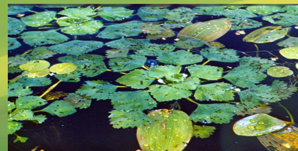
Чилим – Водяной орех