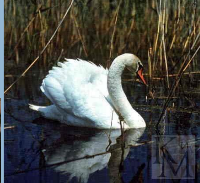
Лебедь - шипун