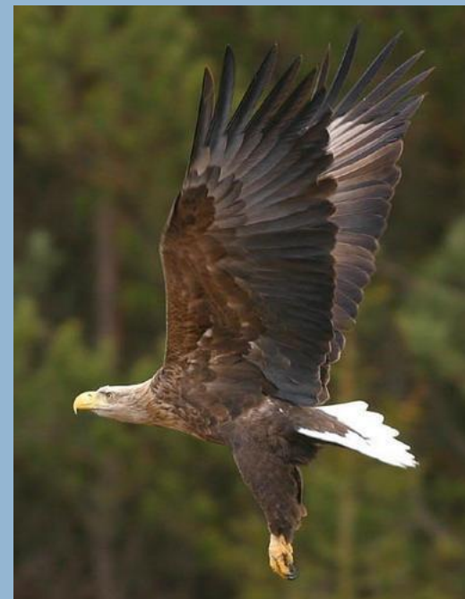
Орлан – белохвост