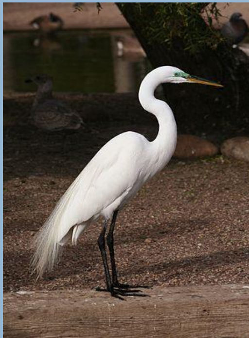
Большая белая цапля