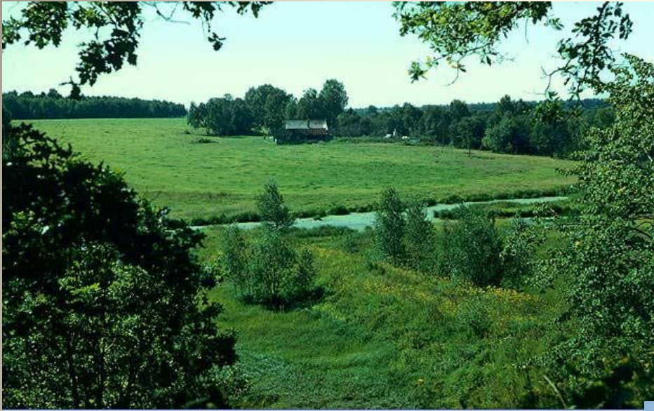
Русская равнина. Река Пра в Мещере.