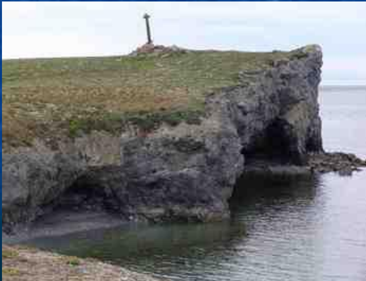
Поморский приметный крест

Вайгач – это единственный в своем роде «священный остров» коренных народов Севера. Здесь они поклонялись своим божествам.