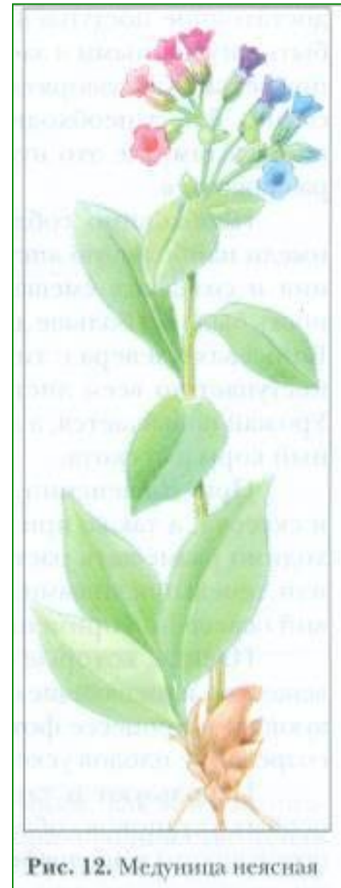
Рис. 12. Медуница неясная