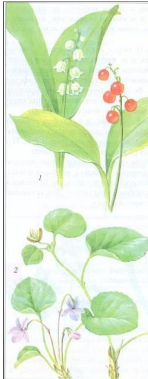
Рис. 10. Летнезеленые растения с цветками и плодами: 1 – ландыш майский; 2 – фиалка удивительная