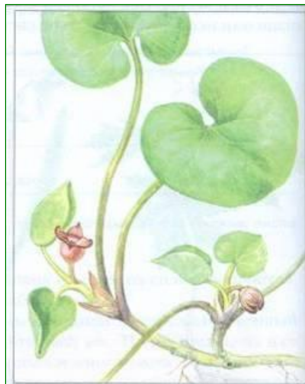
Рис. 11. Вечнозеленое растение копытень европейский с молодыми и прошлогодними листьями