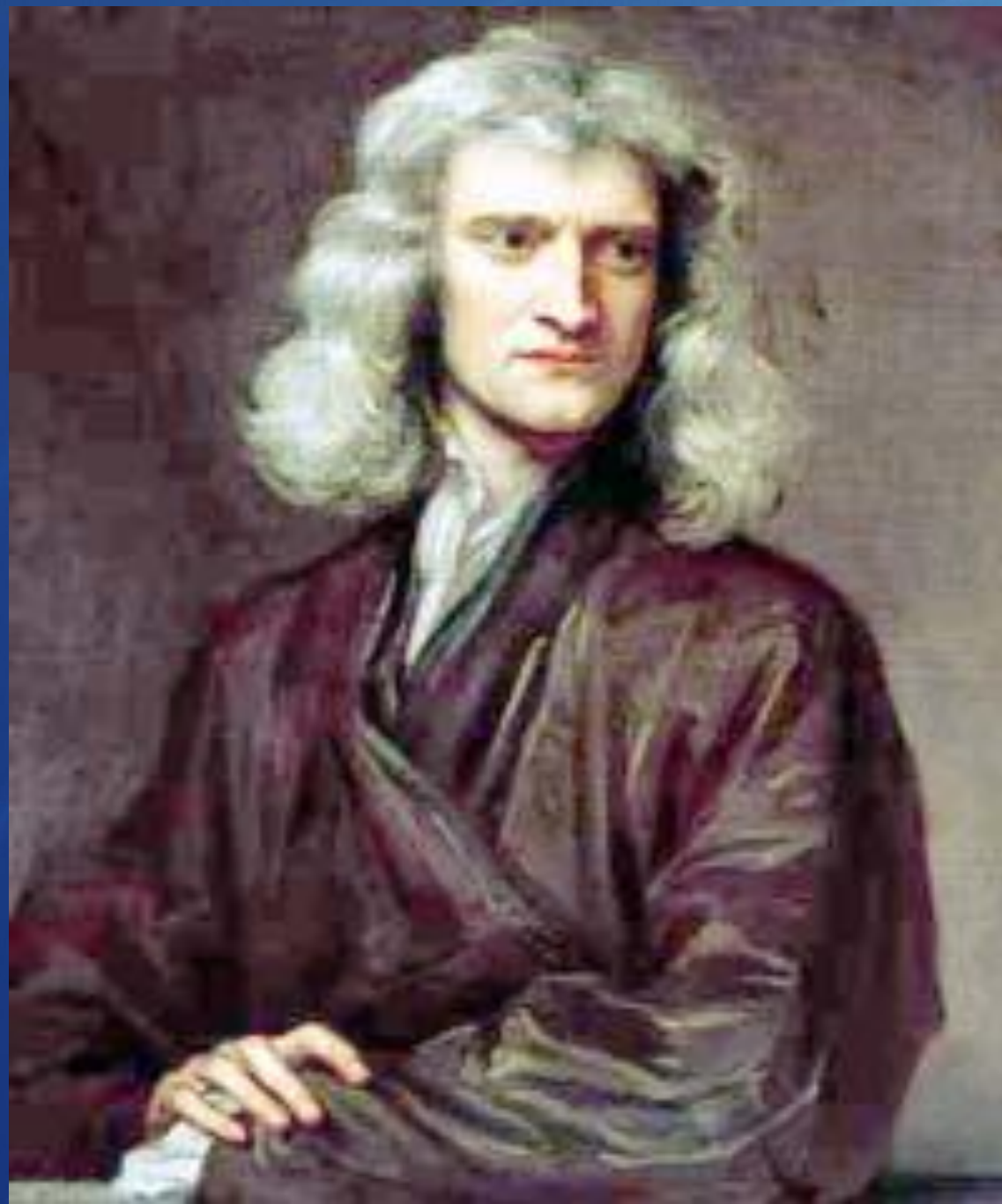
Исаак / НЬЮТОН