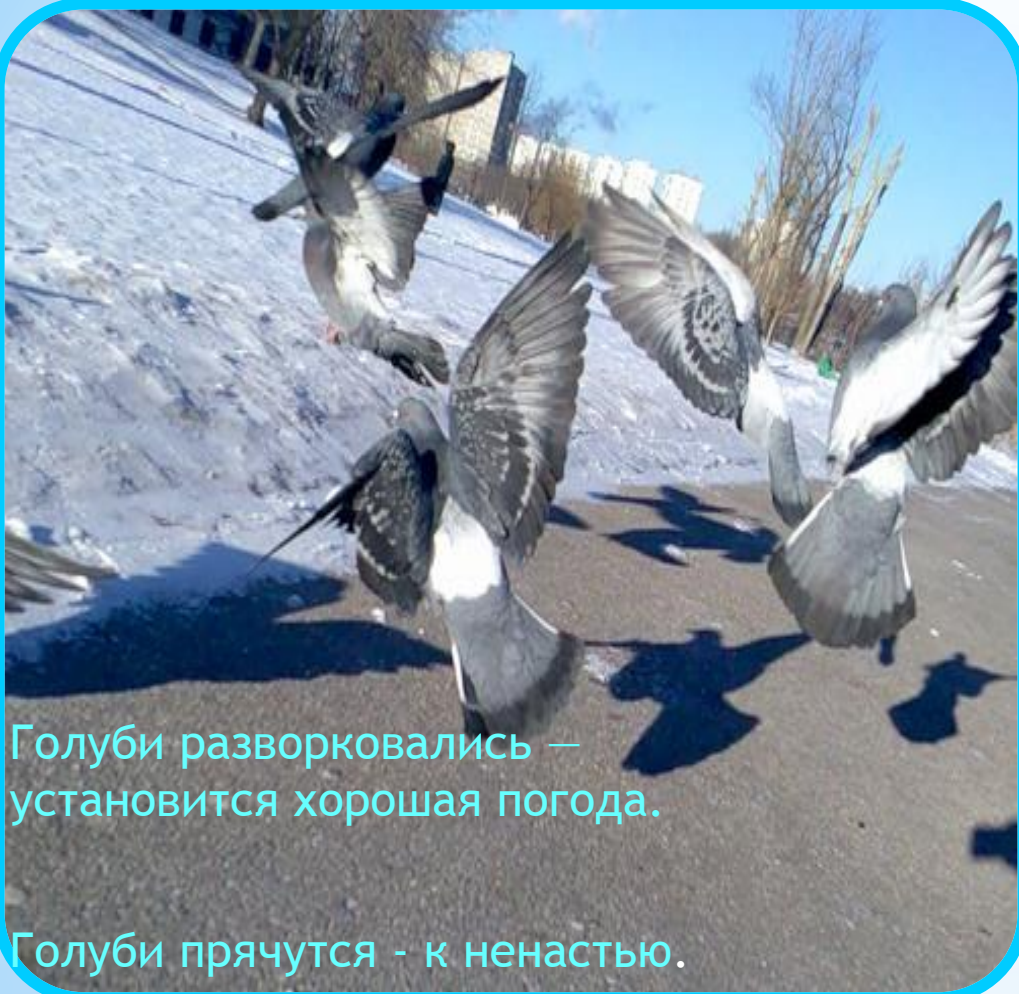
Голуби разворковались — установится хорошая погода.