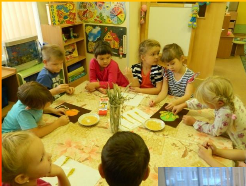
Рисование поля пшеницы