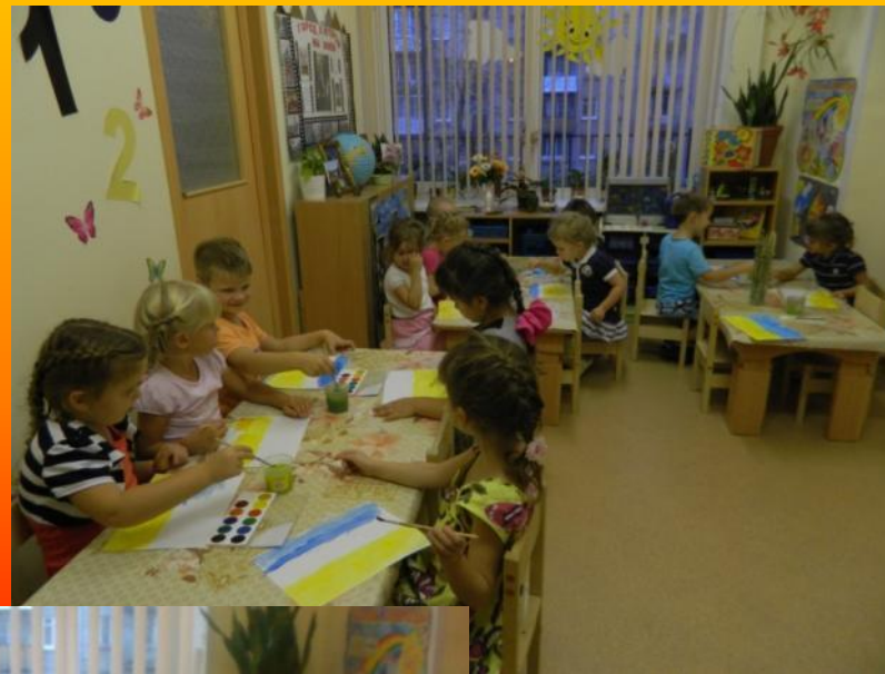
Рисование поля пшеницы