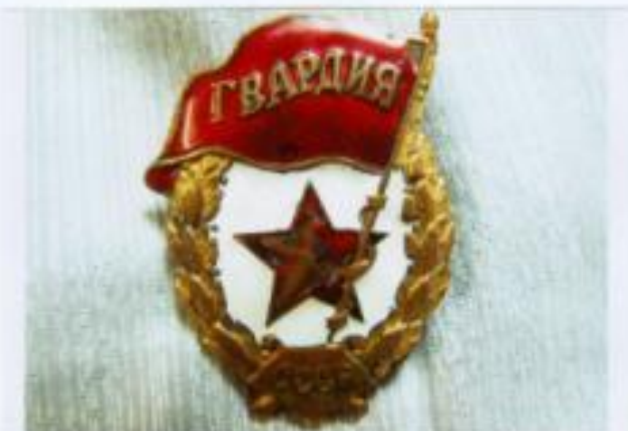
Знак «Гвардия СССР»