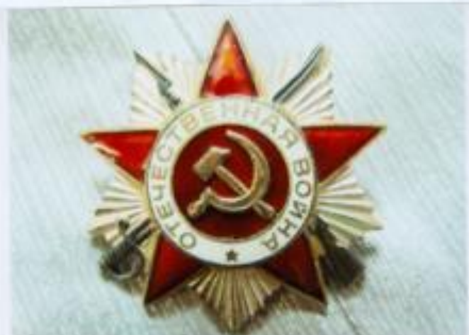
Орден «Отечественная Война»