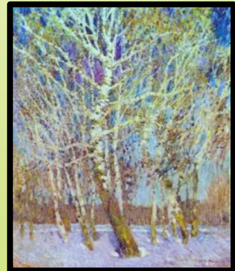
И. Э. Грабарь «Февральская лазурь»