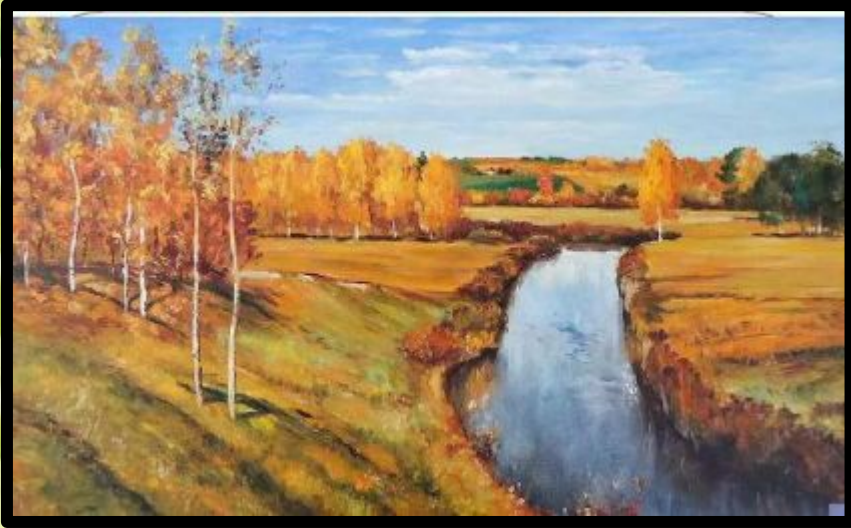
И.И. Левитан «Золотая осень»

Образ березы как символ Родины, России постоянно встречается в произведениях многих выдающихся художников. И каждый художник видел в березе свою красоту.