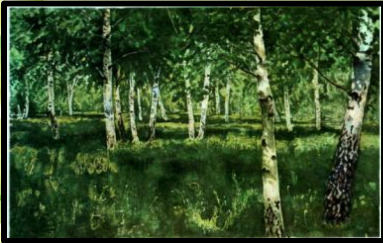
И. И. Левитан «Березовая роща»