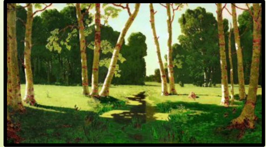
А. И. Куинджи «Берёзовая роща»