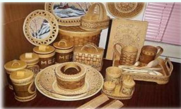
Изделия из бересты