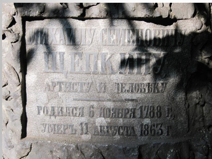
надпись на надгробном камне М.С Щепкина

Михаил Щепкин скончался 11 августа 1863 года в Ялте, он похоронен на Пятницком кладбище в Москве.