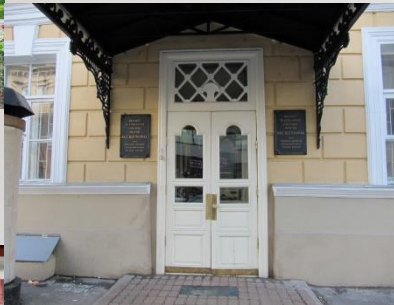
Щепкинское театральное училище