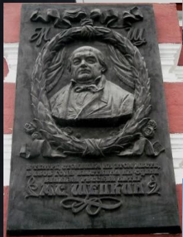
Мемориальная доска в Курске на «Доме офицеров»