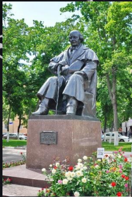
Памятник в г. Белгороде