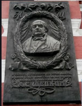
Мемориальная доска в Курске на «Доме офицеров»