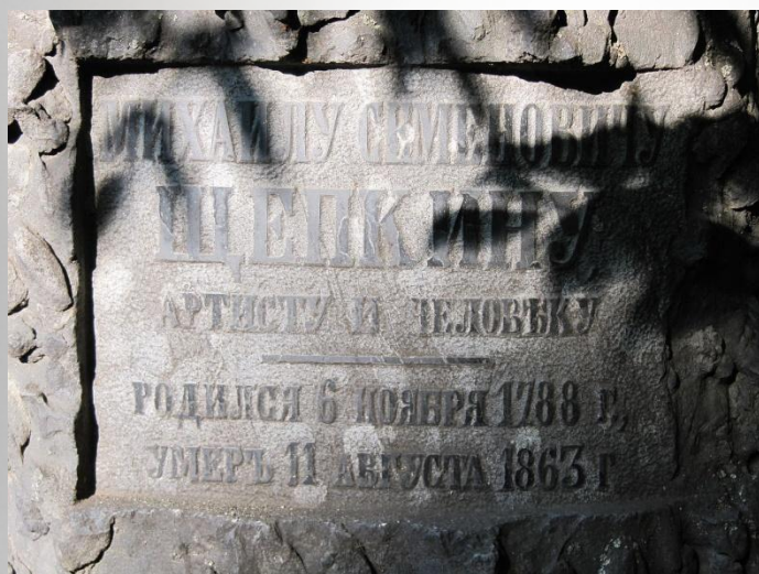
надпись на надгробном камне М.С Щепкина

Михаил Щепкин скончался 11 августа 1863 года в Ялте, он похоронен на Пятницком кладбище в Москве.