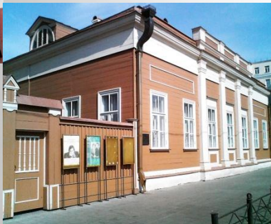
дом-музей в Москве ул. Щепкина, 47

Имя актёра носит областной драматический театр в г. Белгороде. Перед театром установлен памятник Щепкину.