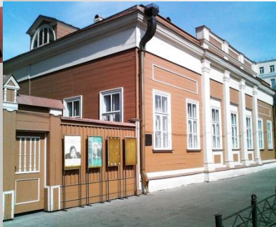
дом-музей в Москве ул. Щепкина, 47

Имя актёра носит областной драматический театр в г. Белгороде. Перед театром установлен памятник Щепкину.