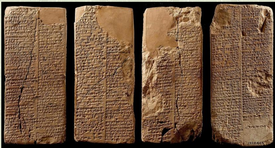
Глиняные таблички (шумеры)