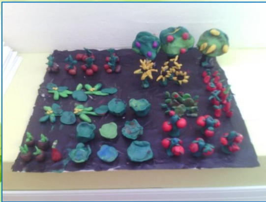
Лепка «На нашем огороде»