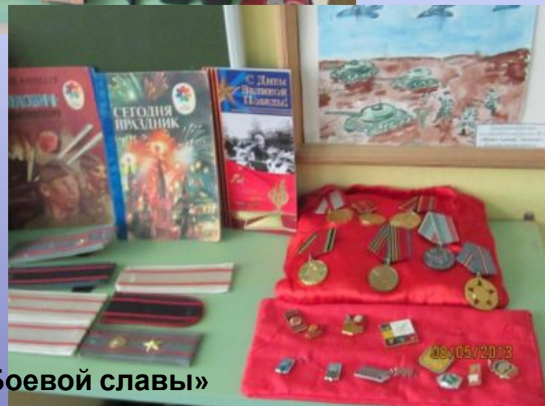
Уголок «Боевой славы»