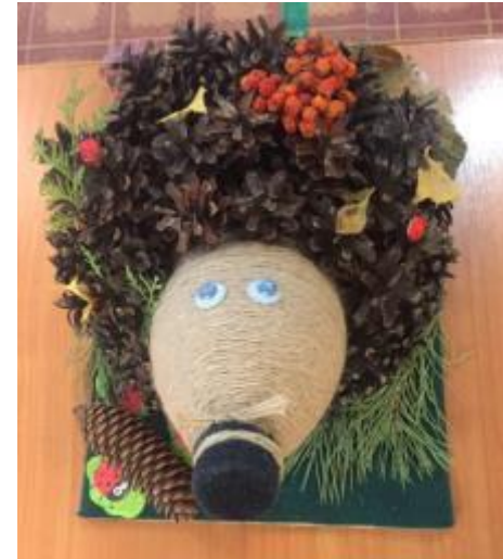
Рисунок мамы Шитовой Киры