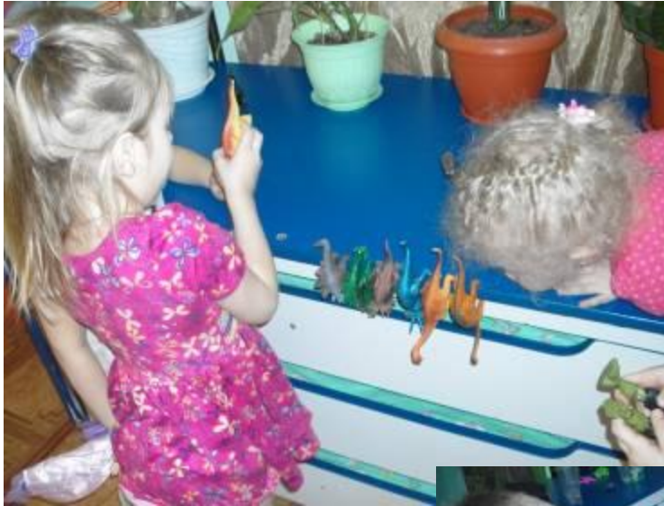
Чей дольше провесит