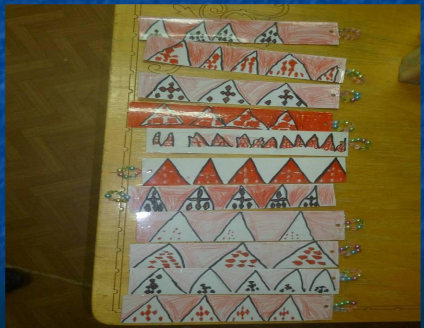
Закладка для книги Орнамент «Чум»