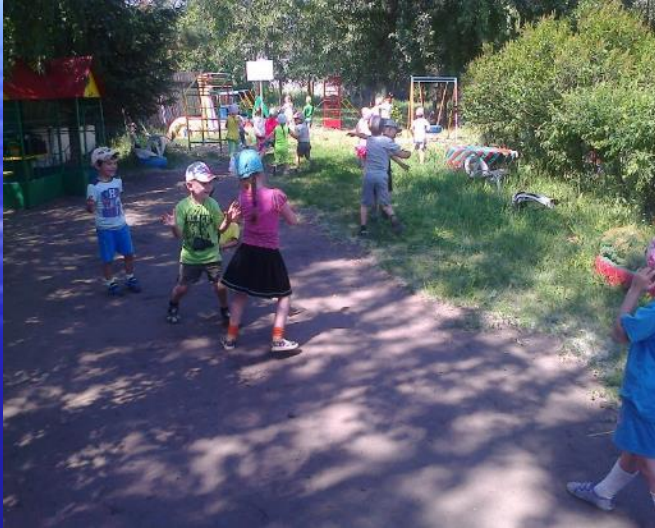
"Летает, плавает, бегаёт"