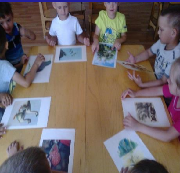
"Откуда птица прилетела?"