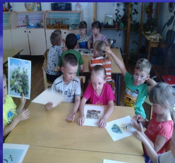
"Узнай и назови"