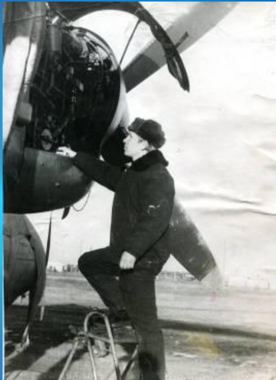
Дедушка - авиамеханик