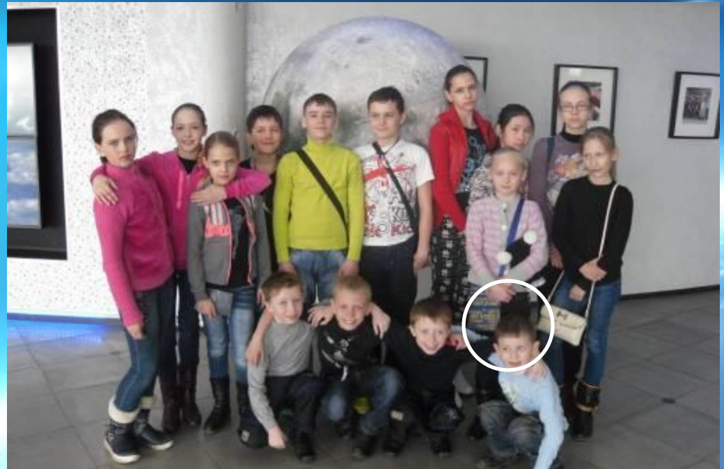
Группа детей «Детской школы искусств»