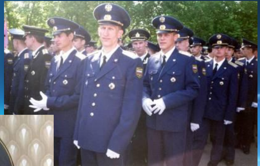
Дядя - бортинженер