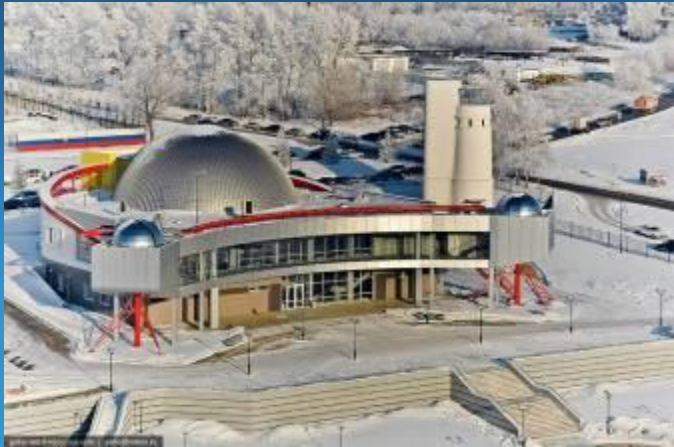
Планетарий (г. Новосибирск)