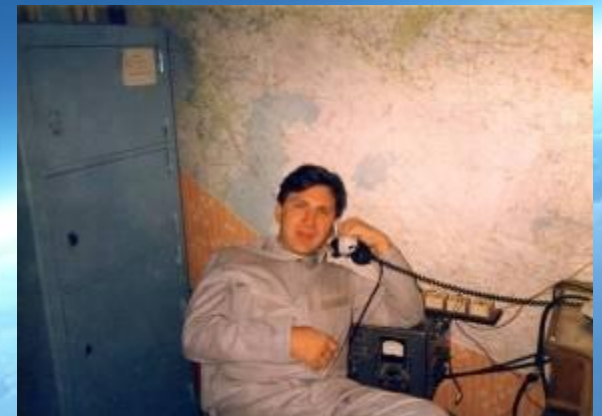
Папа - авиадиспетчер