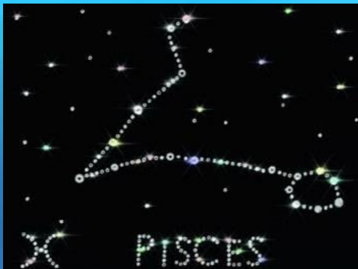
Мой знак – «Рыбы»