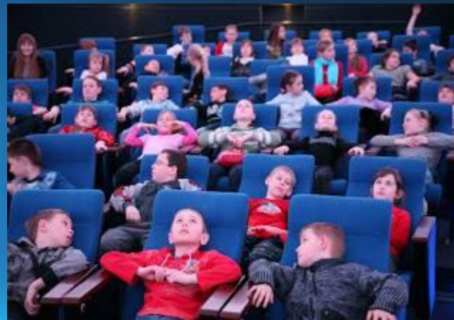
Просмотр фильма в Планетарии