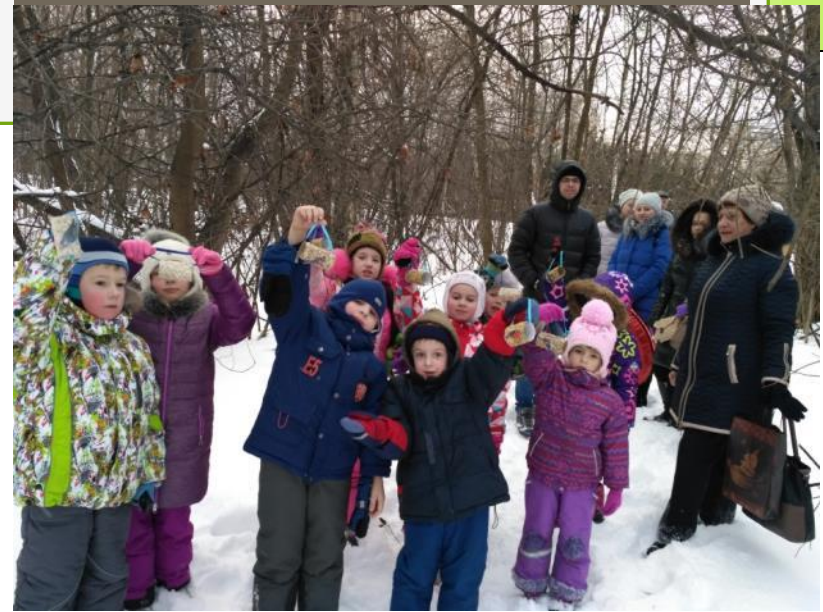
Развешивание кормушек в парке